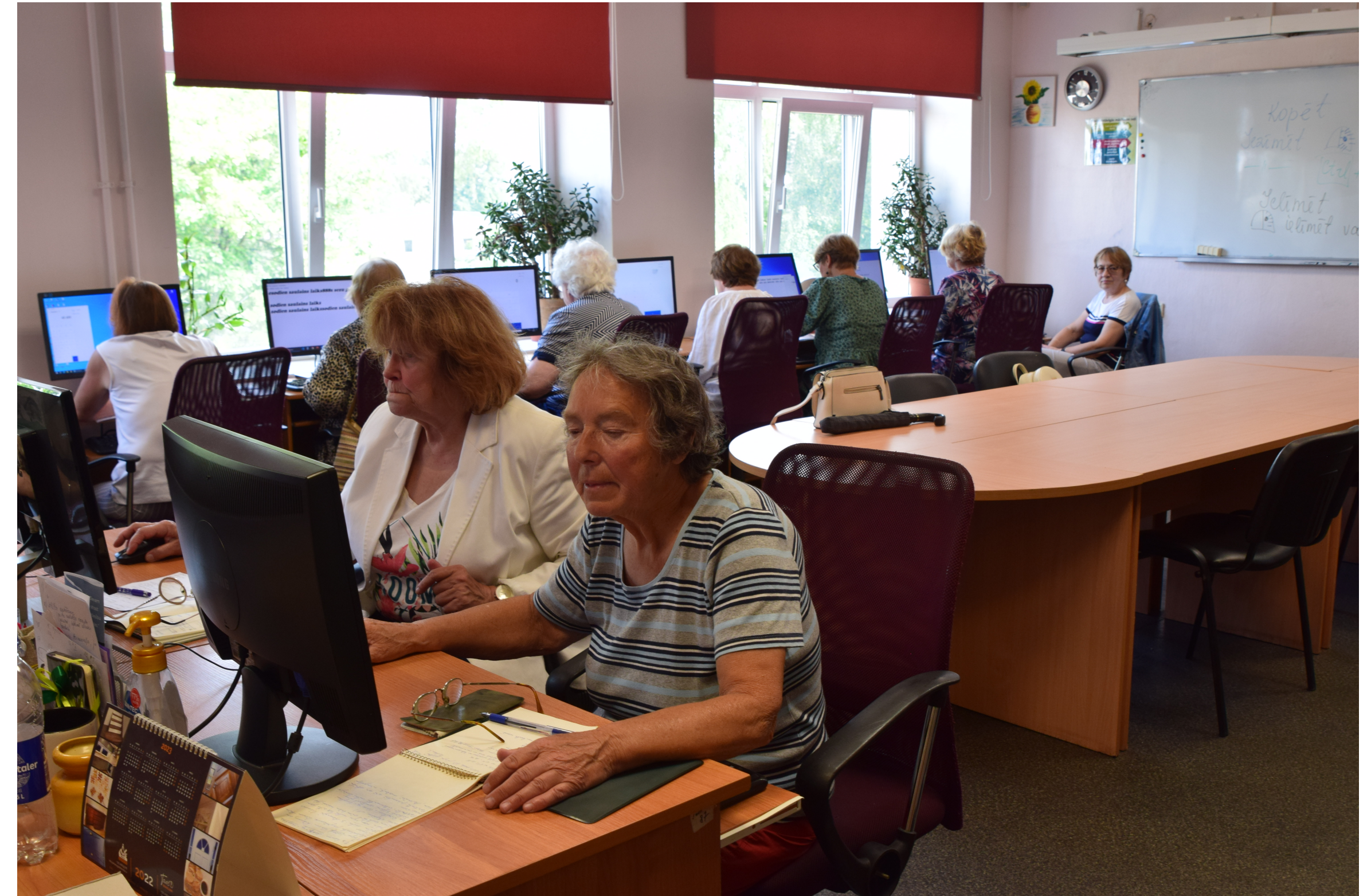
Kuldīgas Senioru skola īsteno projektu "Senioru digitālā mobilitāte", 2023.gads

(1) Sabiedrība piedalās izglītības organizēšanā un attīstībā, popularizējot visu veidu izglītību, veicot izglītošanu un sekmējot izglītības kvalitātes uzlabošanu, veidojot izglītības programmas, aizsargājot izglītojamo un pedagogu tiesības un intereses izglītības ieguves un darba procesā, veidojot izglītības un izglītības atbalsta iestādes, biedrības un nodibinājumus.