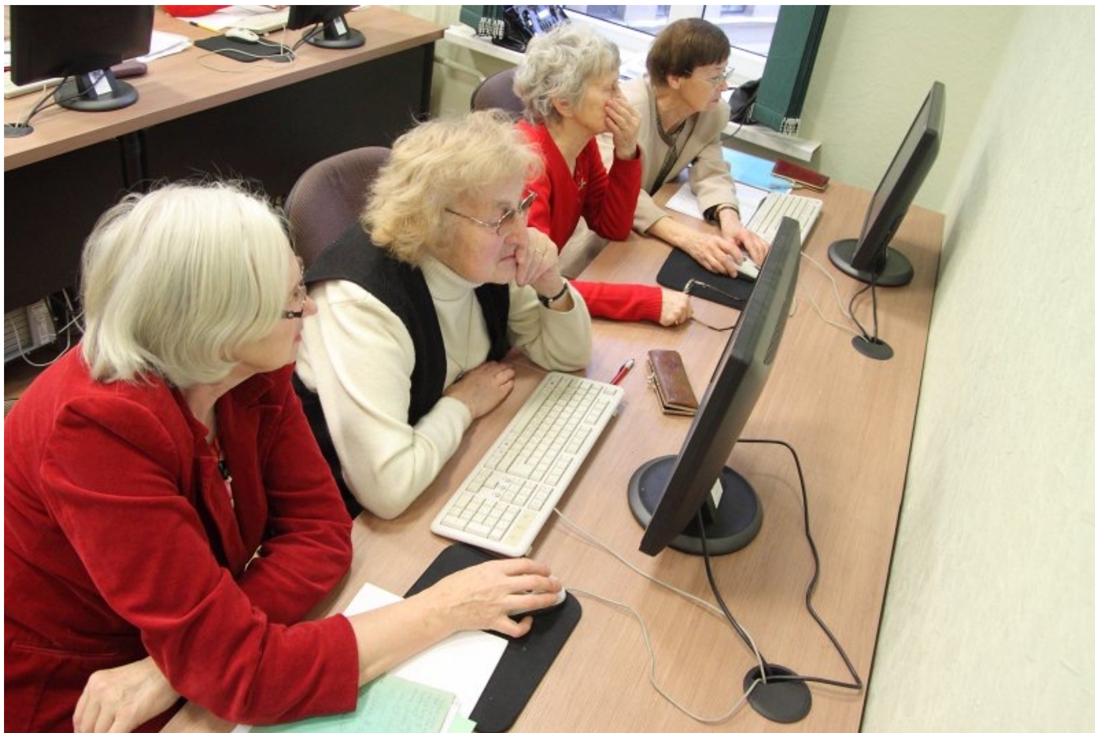
Latvijas Universitātes Senioru klubs, 2022.gads