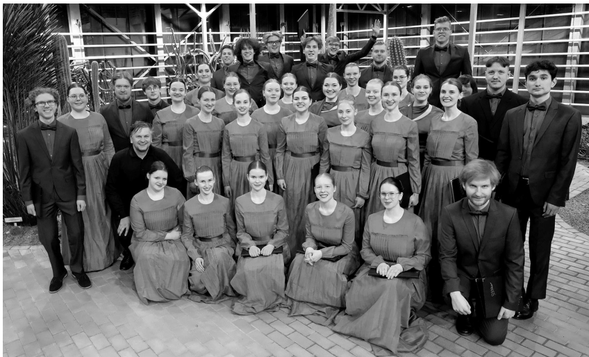
Jauniešu koris BALSIS .

Skanēs 2024. gada spilgtāko programmu „uvertūra“: Amandas ūtopija, Saules Grieze, Ventas BALSIS , Upītes uobeļduorzs, citāDs citāTs 2, Klusuma aug(ī) 2, Japānas un ASV tūres spilg-