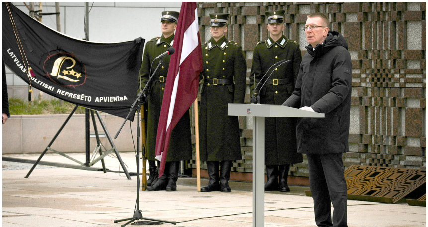
Valsts prezidents pie padomju okupācijas upuru piemiņas memoriāla.

Tādēļ aicinu šodien godināt visus tos, kuri gāja bojā Staļina lēģeros. Aicinu pieminēt visus tos, kuri šobrīd turpina cīnīties pret ļaunumu. Mēs visi kopā spēsim to pārvarēt!