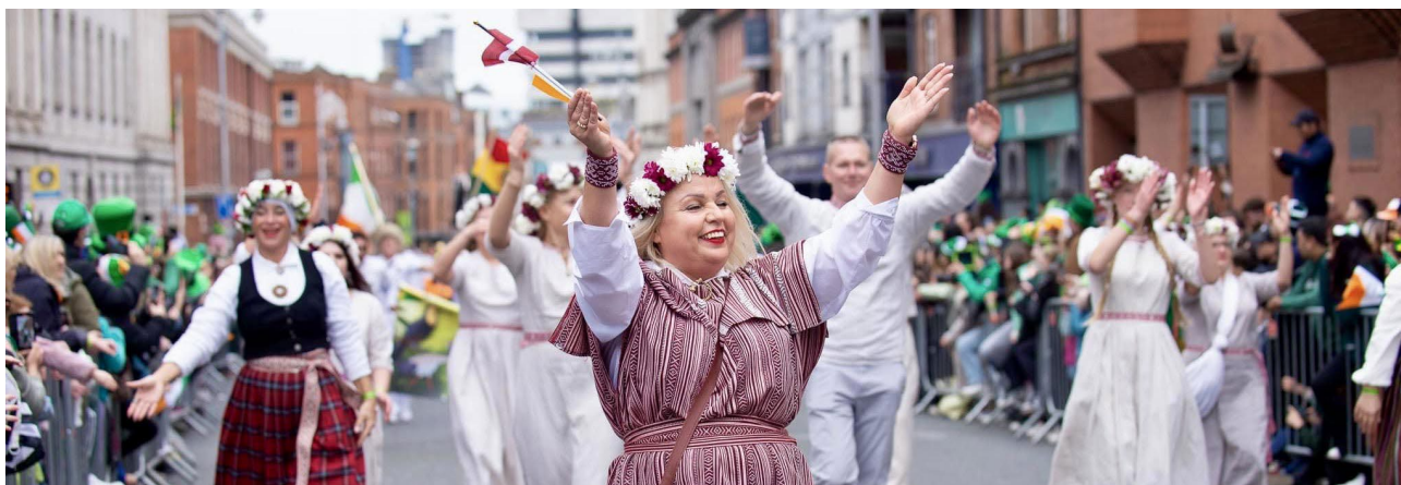
Koris „eLVé“ Sv. Patrika dienas parādē Īrijā.