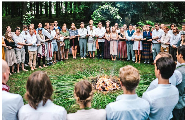
Latviešu jaunatnes seminārs „2x2”.

Par Atgriešanās semināra norises vietu ir izvēlēts Latviešu centrs Bērzaine , kas atrodas Freiburgā, Vācijā. Nams ir īpaša vietā daudzām pasaulē latviešiem, jo tas ir viens no tikai dažiem publiski pieejamiem latviešu īpašumiem Eiropā. Senā māja Cēringenas pilsdrupu pakājē, kas sākotnēji bija paredzēta kā karā cietušu latviešu karavīru mītne, pakāpeniski ir pārvērtusies par viesu namu, kur šodien var