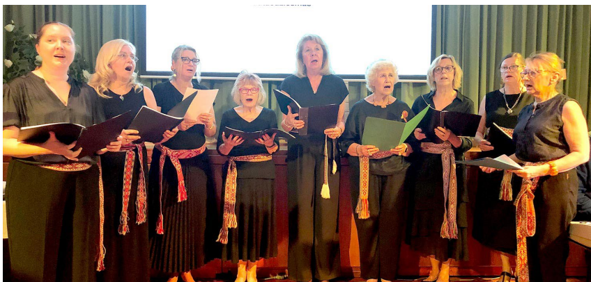
Sidnejas koris SKANDA dzied.